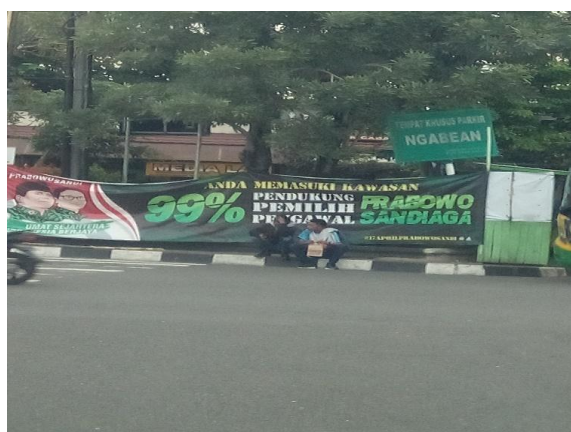
Gambar 6. Contoh Pemasangan Spanduk dan Atribut Partai Politik di suatu Daerah

Selain munculnya kampung Jokowi, juga muncul kampung pasangan capres 02 Prabowo Subianto dan Sandiaga Uno saat pilpres 2019 yang lalu. Kampung Prabowo-Sandiaga tampak terlihat dari spanduk/baliho yang terpasang di pinggir jalan sekitar terminal Ngabean Kota Yogyakarta yang merupakan basis pendukung PPP terutama basis Gerakan Pemuda Ka'bah (GPK). Pada spanduk tersebut bahkan diklaim sebagai kampung 99% pendukung Prabowo dan Sandiaga. Klaim ini menunjukkan solidaritas sosial politik warga kampung sekitar terhadap calon yang mereka dukung. Dukungan semacam ini mengandung suatu pesan dan ekspektasi politik atau dan Fenomena ini, sepanjang penyelenggaraan kampanye para calon. Dari fenomena di atas, tampak bahwa klaim kampung partai tidak saja tampak dari dominannya bendera tertentu, akan tetapi juga tampak dari adanya pemasangan spanduk-spanduk dan baliho tokoh politik atau calon yang mereka usung dalam pilpres.