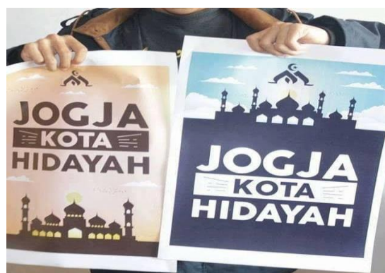
Gambar 2. Contoh Leaflet Muslim United

Muslim United (MU) adalah kegiatan yang berisi dakwah, bazaar dan aktivitas ekonomi lainnya yang diselenggarakan oleh Forum Ukhuwah Islamiyah (FUI) dan Takmir Masjid Gedhe Kauman. Kegiatan ini telah dilakukan sebanyak dua kali, yaitu tahun 2018 dan tahun 2019. Pada kegiatan pertama, tagline yang diusung adalah “MUSLIM UNITED DAY #1 JALAN TERUS DIJALAN YANG LURUS ( ISTIQOMAH DALAM ISLAM ). Bahkan di Facebook panitia MU 1 terpampang gambar dengan tulisan “Jogja kota Hidayah”, seperti pada gambar berikut ini: