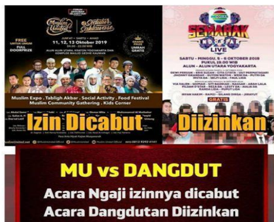
Gambar 3. Persaingan Acara Massal yang Bersifat Religius dan Pestapora