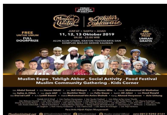
Gambar 1. Contoh Poster Aktivitas dari Kelompok Masyarakat dengan Identitas Tertentu

Muslim United (MU) adalah kegiatan yang berisi dakwah, bazaar dan aktivitas ekonomi lainnya yang diselenggarakan oleh Forum Ukhuwah Islamiyah (FUI) dan Takmir Masjid Gedhe Kauman. Kegiatan ini telah dilakukan sebanyak dua kali, yaitu tahun 2018 dan tahun 2019. Pada kegiatan pertama, tagline yang diusung adalah “MUSLIM UNITED DAY #1 JALAN TERUS DIJALAN YANG LURUS ( ISTIQOMAH DALAM ISLAM ). Bahkan di Facebook panitia MU 1 terpampang gambar dengan tulisan “Jogja kota Hidayah”, seperti pada gambar berikut ini: