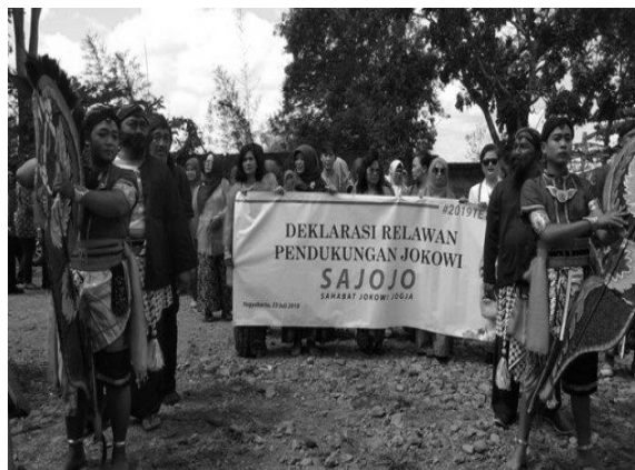
Gambar 5. Labeling suatu daerah dengan atribut atau identitas tertentu 2