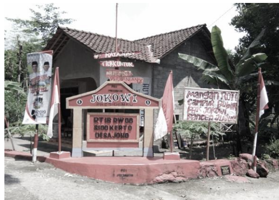
Gambar 4. Labeling suatu daerah dengan atribut atau identitas tertentu 1

Kampung Jokowi adalah kampung yang diberi label oleh para pendukung Jokowi saat pelaksanaan pilpres tahun 2019. Di Jawa Tengah, khususnya di Klaten dan Solo labeling Jokowi terhadap kampung-kampung banyak ditemukan. Namun yang tampak pada foto ini adalah salah satu kampung di Sidokarto Godean Sleman.