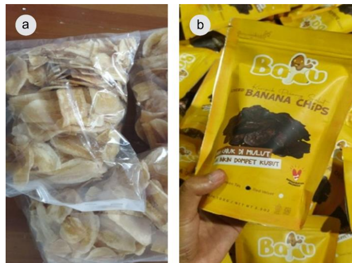
Gambar 2. Tampilan produk turunan pisang: (a) Sebelum KKN-PPM UGM; (b) Setelah KKN-PPM UGM

Usaha "Keripik Pisang Salut" ( Gambar 2 ) adalah salah satu inisiatif yang muncul untuk mengatasi tantangan ini. Dengan menggunakan bahan baku pisang lokal, produk ini dikembangkan sebagai camilan yang dapat dipasarkan tidak hanya di Yogyakarta, tetapi juga di seluruh Indonesia. Produk ini memiliki tiga varian rasa, yaitu coklat, green tea , dan red velvet , yang diharapkan mampu menarik minat konsumen dari berbagai kalangan, terutama generasi muda yang cenderung menyukai inovasi rasa. Profil usaha ini menunjukkan bahwa "Keripik Pisang Salut" tidak hanya fokus pada produksi, tetapi juga pada pemberdayaan masyarakat lokal. Bahan baku pisang diambil langsung dari petani Desa Mertelu, yang kemudian diproses dan dikemas oleh warga setempat. Dengan demikian, usaha ini tidak hanya meningkatkan nilai tambah produk pisang, tetapi juga memberikan dampak positif pada perekonomian lokal.