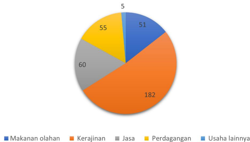
Gambar 1. Hasil pendataan jenis UMKM di Kalurahan Mertelu

untuk memahami kondisi UMKM, tetapi juga menjadi dasar untuk merancang program pengembangan yang tepat sasaran, termasuk dalam aspek legalitas dan sertifikasi produk.