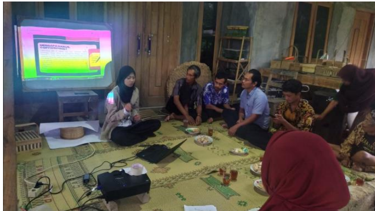
Gambar 4. Sosialisasi copywriting

Dalam era digital seperti sekarang, penggunaan teknologi dalam pemasaran menjadi sangat penting. Hal ini disadari oleh Tim KKN-PPM UGM, yang kemudian mengadakan program pelatihan khusus tentang pemasaran digital bagi pelaku UMKM di Desa Mertelu ( Gambar 4 ). Program ini bertujuan untuk membantu pelaku UMKM dalam memperluas jangkauan pasar mereka dengan memanfaatkan platform digital yang ada.