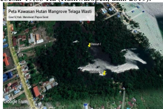
Gambar.1. Lokasi Penelitian.

Penelitian ini dilaksanakan di Kawasan Hutan Mangrove Telaga Wasti Manokwari Provinsi Papua Barat. Penelitian ini dilakukan pada bulan Mei-Juli 2022. Telaga Wasti sendiri secara geografis terletak pada koordinat 00°55.032'LS dan 134°02.480 BT sebelah selatan Manokwari dengan luas kawasan sebesar 19,03 Ha (Rumwaropen, dkk. 2019).