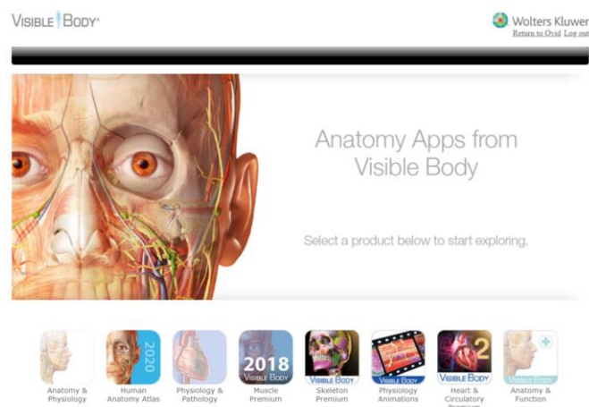
Gambar 1. Aplikasi 3D Anatomi 1

Aplikasi kedokteran yang banyak dipergunakan pada kegiatan MeLCom adalah aplikasi tiga dimensi untuk anatomi ( Visible Body by OVID) terlihat pada Gambar 1. dan aplikasi cara belajar ilmu kedokteran yang disajikan dengan membahas setiap kasus dalam tampilan yang menarik secara visual ( OSMOSIS by Elsevier) seperti pada Gambar 2. Melalui sumber daya tersebut perpustakaan berupaya memaksimalkan penggunaan fasilitas yang telah dimiliki fakultas.