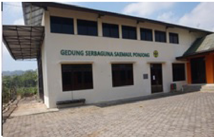
Gambar 3. Gedung serbaguna Saemaual ponjong dan BUMDES Ponjong hasil bantuan dari Yayasan Globalisasi Saemaual Indonesia (Korea Selatan).

Yayasan ini mendirikan kantor dan sarana prasarana di belakang kantor Balai Desa Ponjong. Gedung serbaguna sumbangan yayasan ini dimanfaatkan oleh masyarakat untuk berbagai kegiatan, bahkan kantor BUMDES Desa Ponjong juga terletak di salah satu ruang gedung ini. Posisi gedung Semaul Undong ini juga hanya berjarak sekitar 100 meter dari lokasi wisata Water Byur Ponjong. Keberadaan yayasan dan sarana prasarana yang disediakan juga menjadikan potensi pengembangan wisata desa cukup terbuka lebar.