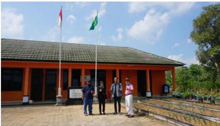
Gambar 7. Tim PkM Prodi Sastra Jawa meninjau kawasan sekitar gedung serbaguna Saemamaul Ponjong

Selain hal tersebut, secara kelembagaan, para pengelola dibantu untuk mempunyai sarana pertemuan. Dengan sarana itu, harapannya mereka dapat saling berkomunikasi untuk menghidupkan dan mengembangkan kembali lokasi wisata Water Byur yang mereka miliki. Dalam hal ini, pekerjaan dan kegiatan mereka dapat dipantau dari jauh. Demikian pula dalam hal promosi, pada awalnya kegiatan tersebut dibantu dengan pembuatan redaksi tatanan untuk berkunjung ke objek wisata Water Byur sesuai protokol COVID-19 atau kondisi new normal .