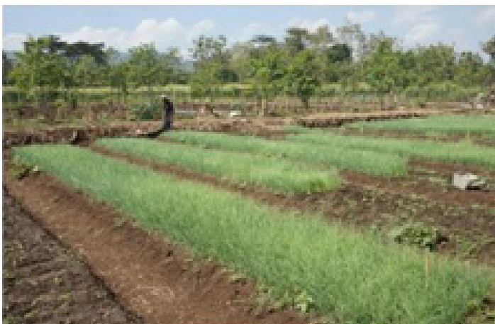
Gambar 1. Potensi wisata Desa Ponjong berupa persawahan dan perkebunan.

Dilihat dari tata guna lahan yang ada dengan didukung sumber daya air yang berlimpah, secara umum dapat digambarkan bahwa fungsi wilayah perencanaan masih didominasi oleh ruang terbuka berupa lahan kering dan lahan pertanian yang dilayani