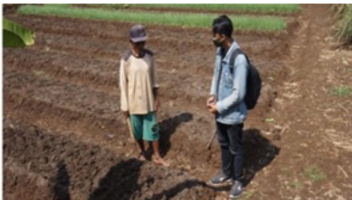
Gambar 5. Tim PkM Prodi Sastra Jawa mendengarkan keluhan masyarakat Desa Ponjong (pengelola wisata dan petani) yang ingin membangkitkan lagi potensi desa pascapandemi