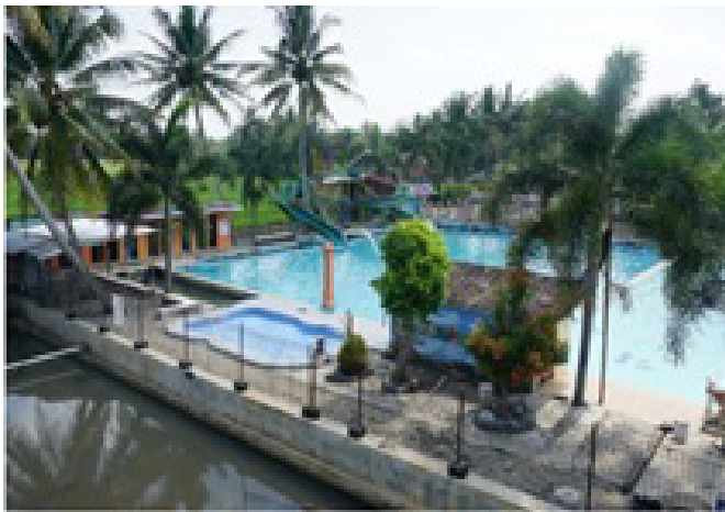
Gambar 4. Water Byur Ponjong yang tampak sepi akibat pandemi Covid-19.

wilayah Indonesia secara menyeluruh. Kondisi objek wisata Water Byur Desa Ponjong sejak awal Maret 2020 berada di titik awal kebangkrutan dan nyaris tutup karena tidak ada pengunjung yang datang. Menjelang bulan Ramadhan, objek wisata ini biasanya ramai didatangi pengunjung untuk melaksanakan padusan atau mandi bersama dalam rangka menyambut bulan puasa, tetapi pada bulan Ramadan tahun 2020, objek wisata ini bahkan harus ditutup.