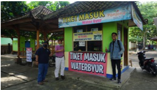
Gambar 6. Tim PkM Prodi Sastra Jawa meninjau kawasan wisata Water Byur Desa Ponjong

Sastra Jawa dilakukan dengan menerjunkan beberapa anggota tim ke lokasi sasaran. Proses kegiatan ini dilakukan dengan protokol kesehatan yang telah ditentukan. Konsep meminimalkan risiko penularan COVID-19 dilakukan sepenuhnya oleh tim sesuai kondisi yang ada.