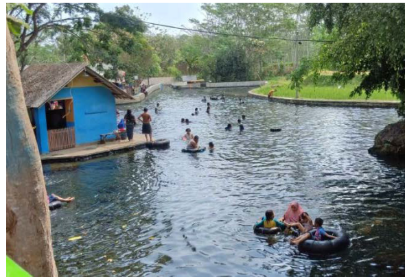
Gambar 2. Zona B Wisata Alam Sumber Maron