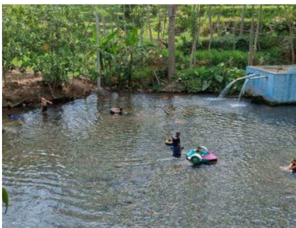
Gambar 1. Zona A Wisata Alam Sumber Maron

Selain berdampak terhadap lingkungan dari Wisata Alam Sumber Maron, nyatanya terdapat peraturan pemerintah yaitu Undang-Undang Republik Indonesia Nomor 26 Tahun 2007 Tentang Penataan Ruang yang menjelaskan bahwa lahan yang harus terbebas dari bangunan paling sedikit adalah 30%. Sementara ini di Wisata Alam Sumber Maron memiliki luas area untuk wisata sebesar 13.000 m 2 dan luas lahan terbangun sebesar 6.038 m 2 . Artinya bahwa lahan terbangun di kawasan ini sebesar 46% dan lahan tidak terbangun (ruang terbuka hijau) sebesar 54%. Dari persentase tersebut apabila tidak ada penanganan atau pembatasan maka akan melebihi batas ketentuan dari ruang terbuka hijau yang telah tertulis dalam peraturan pemerintah.