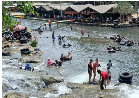
Gambar 3. Zona C yang menyerupai air terjun dan sungai.

Menurut Damanik dan Weber (2006), pembangunan sumber daya pariwisata yang berkelanjutan mampu memberikan keuntungan yang optimal bagi pemangku kepentingan dan nilai kepuasan optimal bagi wisatawan dalam jangka panjang. Untuk itu perlu dilakukannya sebuah penelitian dan kajian dengan tema "Strategi Pengelolaan Pariwisata Berkelanjutan di Kawasan Wisata Alam Sumber Maron Kecamatan Pagelaran, Kabupaten Malang, Jawa Timur". Kajian daya dukung lingkungan bisa menjadi alat yang paling utama untuk dilakukan guna mengevaluasi pengelolaan dan mengoptimalkan kegiatan wisata dari segi lingkungannya. Analisis stakeholder yang memperhatikan keoptimalan bagi pemangku kepentingan yang mengelola wisata tersebut dan Analisis Travel Cost Methods yang