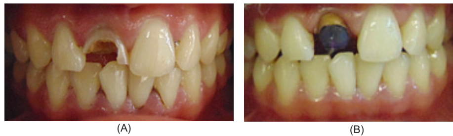
Gambar 2. (A) Gambaran kondisi awal gigi pasien; (B) Hasil model malam pembuatan pasak FRC

gigi pada radiograf dikurangi 1mm. Didapatkan panjang kerja estimasi 15 mm dan dikonfirmasi dengan electric apex locator (Dentaport ZX, J. Morita Mfg. Corp., Kyoto, Japan) . Setelah itu diambil gambaran radiograf dengan menggunakan initial file (file terbesar yang dapat masuk ke dalam saluran akar sesuai panjang kerja sebelum saluran akar dipreparasi) K- file #45 diperoleh panjang kerja 15 mm (Gambar 1B). Dilanjutkan preparasi saluran akar dengan metode konvensional. Preparasi saluran akar dilakukan dimulai dengan K-file #45 sampai K-file #140 dengan panjang kerja tetap 15 mm. Setelah itu diirigasi dengan NaOCl 2,5 % dan EDTA cair 17% lalu dilakukan pengeringan saluran akar menggunakan paper point, dressing saluran akar menggunakan serbuk \text{Ca(OH)}_2 dicampur dengan gliserin. Setelah itu kavitas ditutup dengan tumpatan sementara Caviton.