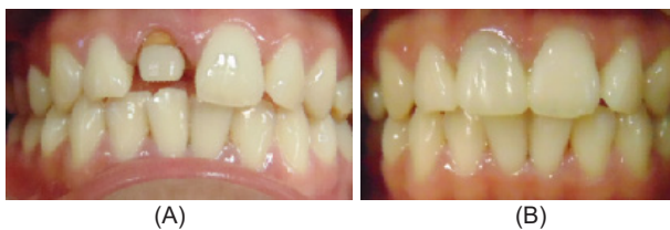
Gambar 4. (A) Hasil insersi pasak FRC; (B) Insersi mahkota jaket komposit.

GC America Inc., USA) pada rahang atas yang telah dipasang model pasak rahang atas (Gambar 3A) dan juga pada rahang bawah. Saluran pasak diirigasi dengan salin, kemudian dikeringkan dengan paper point . Setelah itu saluran pasak ditutup dengan tumpatan sementara double seal (caviton dan GIC). Pasien kemudian dipulangkan. Cetakan rahang atas diisi dengan hydrophilic polysiloxane impression material, type 3 light body (Exaflex, GC America Inc., USA) diikuti dengan vinyl polysiloxane impression material (Putty, GC America Inc., USA) terlihat pada Gambar 3B dan 3C. Untuk pencetakan rahang bawah diisi dengan hard stone gips . Setelah mengeras, dilepas dari cetakan dan diperiksa oklusinya untuk kemudian dibuat pasak resin komposit dengan penguat fiber yang polimerisasinya menggunakan oven.