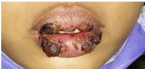
Gambar 1. Kondisi klinis ekstraoral pasien. Terdapat lesi pada bibir atas dan bawah