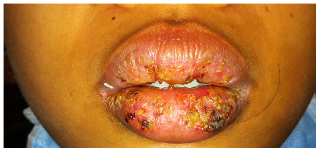
Gambar 3. Lesi pada bibir atas dan bawah mengalami perbaikan

Berdasarkan derajat keparahan lesi dan jumlah mukosa yang terlibat, EM disubklasifikasi menjadi EM tipe minor dan tipe mayor. EM tipe minor memperlihatkan lesi target kulit tipikal dan adanya ulserasi pada satu lokasi atau tanpa keterlibatan mukosa oral. EM tipe mayor memperlihatkan lesi target kulit tipikal dan adanya ulserasi pada beberapa lokasi di mukosa oral. EM dapat dipicu oleh obat atau infeksi virus herpes simplex ( herpes associated erythema multiforme/ HAEM ) atau reaksi merugikan ( adverse reaction ) dari obat ( drug-induced erythema multiforme/ DIEM ). 2,3