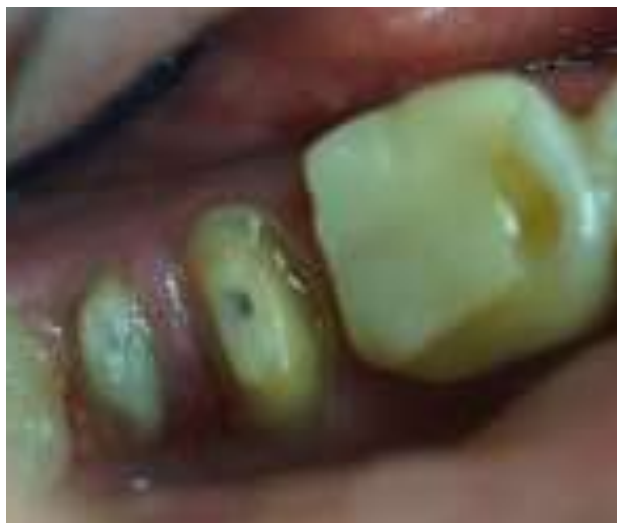
Gambar 3. Preparasi Mahkota gigi 47 yang dibuat menyerupai preparasi premolar