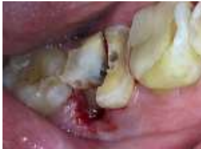
Gambar 2. Pemotongan area bifurkasi dan pengurangan gingiva sisi distal