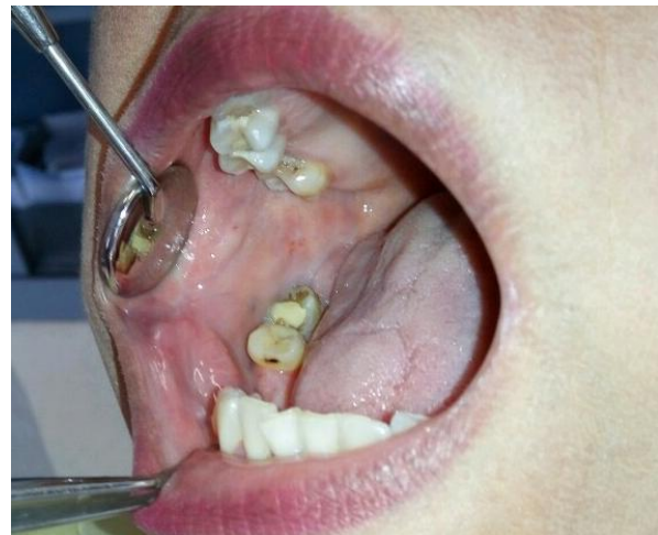
Gambar 6. Foto intra oral satu bulan setelah tindakan injeksi boiling water kedua.