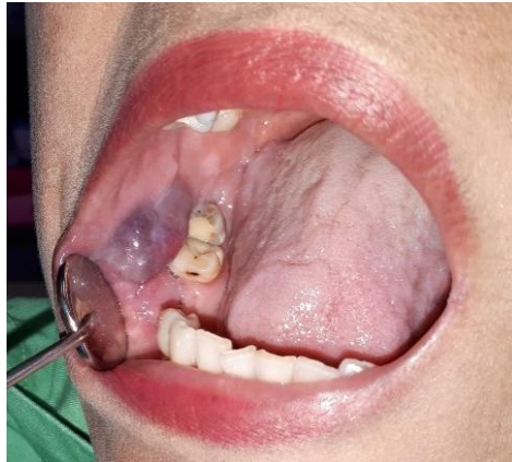
Gambar 1. Foto intra oral, terlihat gambaran lesi hemangioma pada mukosa bukal dekstra