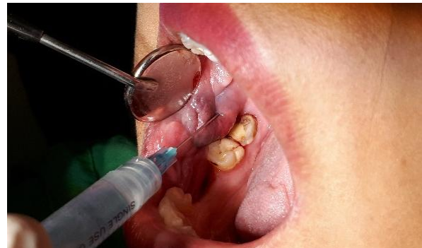
Gambar 3. Penyuntikan dilakukan secara intralesi pada sisi posterior dari lesi