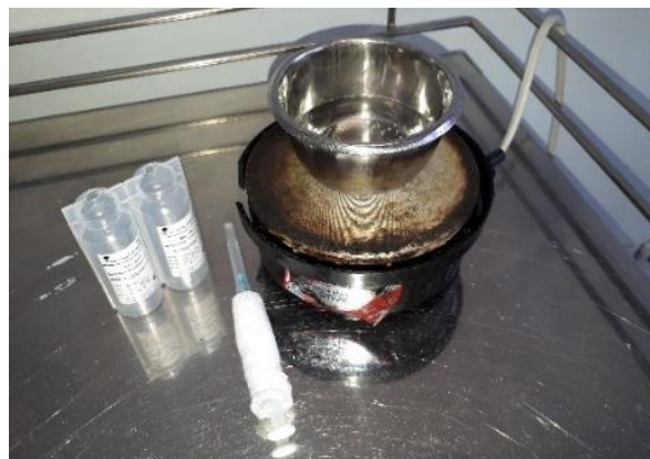
Gambar 4. Persiapan boiling water dengan menggunakan water steril 20 ml yang dipanaskan dengan kompor listrik, dan spuit 3 cc yang dibalut kain kasa.

Penanganan hemangioma pada kasus ini dilakukan dengan injeksi boiling water secara intralesi sebanyak 2,5 ml pada sisi anterior