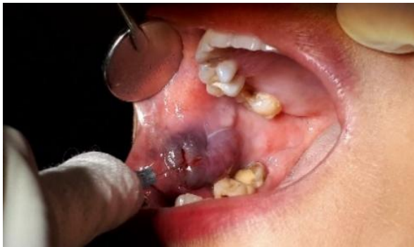
Gambar 2. Penyuntikan dilakukan secara intralesi pada sisi anterior dari lesi