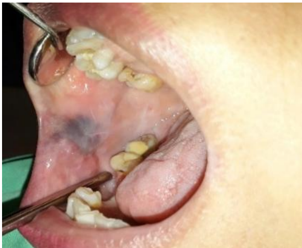
Gambar 5. Foto intra oral satu bulan setelah tindakan injeksi boiling water pertama.