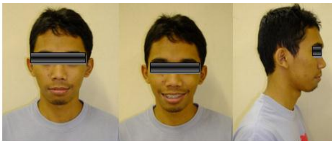
Gambar 2. Foto muka setelah 16 bulan perawatan ortodontik