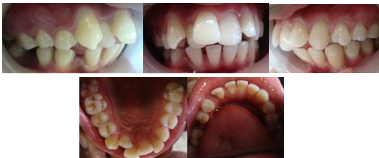
Gambar 3. Foto intra oral sebelum perawatan ortodontik.