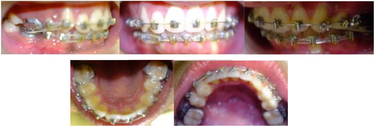
Gambar 4. Foto intra oral setelah 16 bulan perawatan ortodontik.