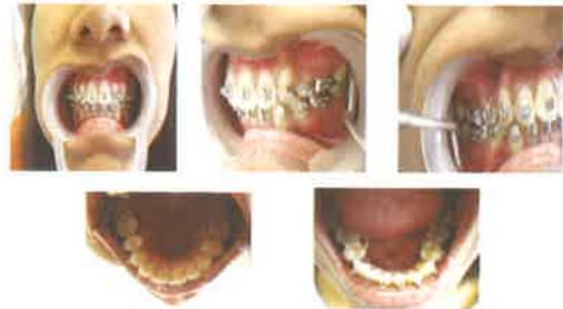
Gambar 7. Foto intraoral setelah 2,5 tahun perawatan