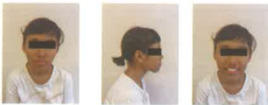
Gambar 2. Foto ekstraoral sebelum perawatan