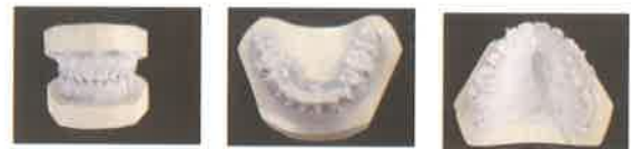
Gambar 8. Foto studi model setelah 2,5 tahun perawatan