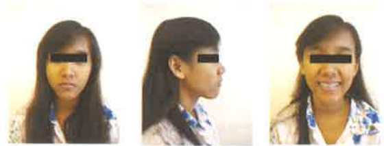
Gambar 6. Foto ekstraoral setelah 2,5 tahun perawatan