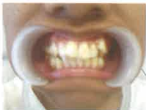
Gambar 3. Foto intraoral sebelum perawatan