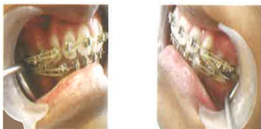
Gambar 5. Foto intraoral selama perawatan dengan teknik Begg