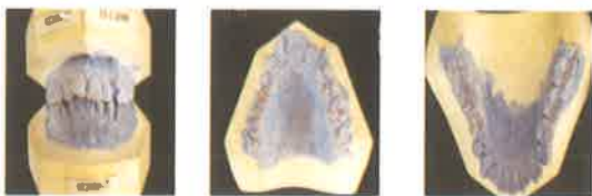
Gambar 4. Studi model pasien sebelum perawatan