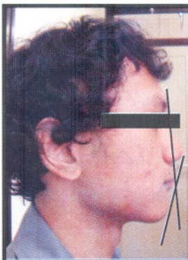
Gambar 1. Foto tampak depan dan profil sebelum perawatan