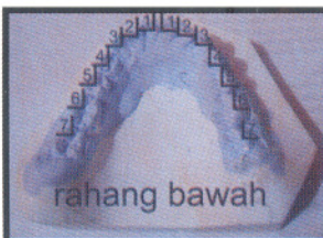
Gambar 2. Studi model pasien sebelum perawatan