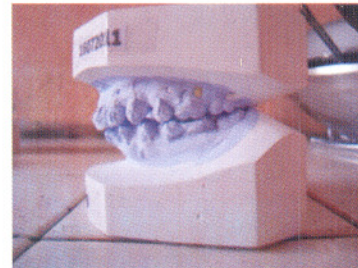
Gambar 3. Foto studi model setelah 3 dan 9 bulan perawatan