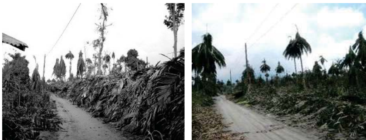
Gambar 1. Kerusakan Lahan Pertanian dan Perkebunan Salak Pondoh di Kecamatan Srumbung Magelang.

tersebut, sangat penting untuk diketahui bagaimana strategi penghidupan masyarakat pasca bencana erupsi tahun 2010. Kehidupan masyarakat dengan mayoritas mata pencaharian sebagai petani dalam situasi kerusakan lahan pertanian akibat bencana tentu didukung oleh kemampuan strategi penghidupan, yang menurut Chambers and Conway (1992, dalam Baiquni, 2007) kemungkinan dapat berupa penciptaan peluang kerja, penanggulangan kemiskinan, kapabilitas, adaptasi kerentanan dan pemulihan, serta keberlanjutan sumberdaya alam.