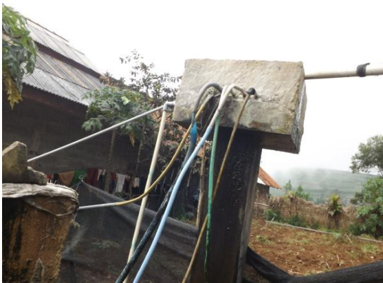
Bak pembagi desa yang berfungsi mambagi air kerumah warga (Desa Sikunang bagian utara, kamera menghadap timur)