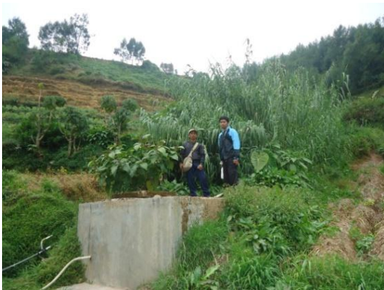
Bak pembagi utama yang berfungsi manampung air (Desa Sikunang bagian selatan, kamera menghadap selatan)

Sistem distribusi air di Desa Sikunang digunakan untuk membagi air berdasarkan volume yang ada agar tidak terjadi kesenjangan dalam pembagian air pada warga. Bak pembagi utama adalah bak yang paling besar diantara bak pembagi yang lain karena bak pembagi utama merupakan bak yang berfungsi menampung air langsung dari sumber mataair. Dari hasil penelitian yang dilakukan dapat diketahui pemanfaatan mataair yang ada di Desa Sikunang berdasarkan aspek teknik operasionalnya disajikan dalam Tabel 4.