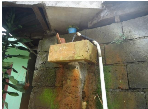
Bak berjalan yang berada di rumah warga (Desa Sikunang bagian utara, kamera menghadap timur)