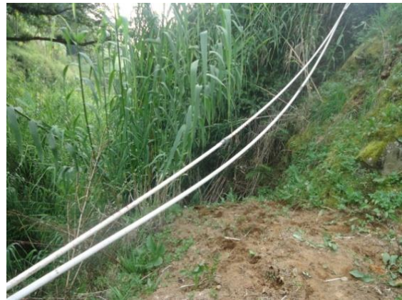
Pipa paralon yang berfungsi untuk mengalirkan air (Desa Sikunang bagian selatan, kamera menghadap utara)