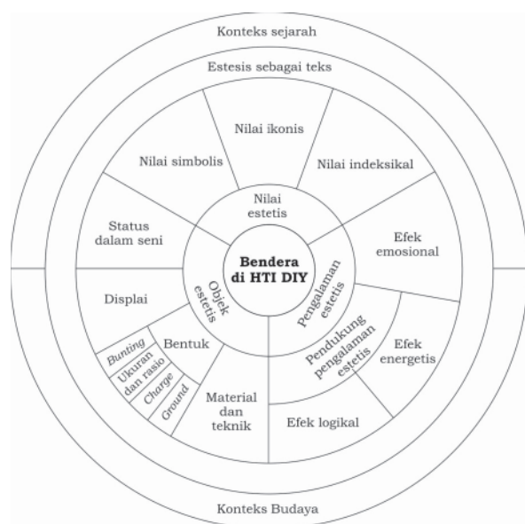
Gambar 3 Skema teori (Dibuat oleh: Deni Junaedi, 2011)

Objek estetis adalah apapun yang dapat merangsang kemunculan pengalaman estetis (Thomas Munro, 1970: 22). Nilai estetis adalah nilai yang dimiliki objek terkait dengan kapasitasnya untuk membangkitkan kesenangan, yang muncul dari ciri objek yang secara tradisional dianggap berharga untuk diperhatikan dan direfleksikan (Marcia Muelder Eaton, 2010:181). Adapun pengalaman estetis adalah pengalaman tentang tanda intrinsik sesuatu yang secara tradisional dianggap berharga untuk diperhatikan dan direfleksikan. Secara ringkas, kerangka teoretik ini dapat dilihat pada skema di bawah ini.