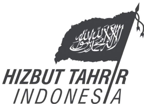
Gambar 5. Logo HTI (Desain oleh: Andika Dwijatmiko)

Pada tataran artefak, maka liwa dan rayah merupakan benda penting di HTI DIY; hal ini terindikasi dari penggunaannya dalam berbagai kegiatan. Selain itu, liwa dan rayah sering menjadi sumber inspirasi untuk membuat desain visual, misalnya, untuk logo HTI bahwa artefak di HTI DIY yang terinspirasi oleh liwa maupun rayah dapat dipandang sebagai derivasi dari bendera di bawah ini.