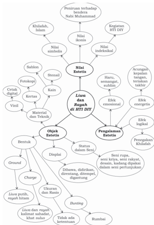
Gambar 9 Skema estetika semiotis liwa dan rayah di HTI DIY (Dibuat oleh: Deni Junaedi, 2012)

Proses kemunculan pengalaman estetis yang dibangkitkan oleh objek estetis di bawah pengaruh nilai estetis disebut estesis. Pengalaman estetis yang muncul pada sabab HTI DIY saat mengamati penggunaan liwa dan rayah sebagai objek estetis dipengaruhi oleh nilai estetis yang terkandung pada objek tersebut, yaitu nilai simbolis, nilai ikonis, dan nilai indeksikal. Nilai tersebut terkandung di dalam objek, yaitu liwa dan rayah , dan tertangkap oleh subjek, yaitu sabab HTI DIY. Secara singkat, estesis yang terjadi pada penggunaan liwa dan rayah di HTI DIY dapat dilihat di skema pada gambar 9.