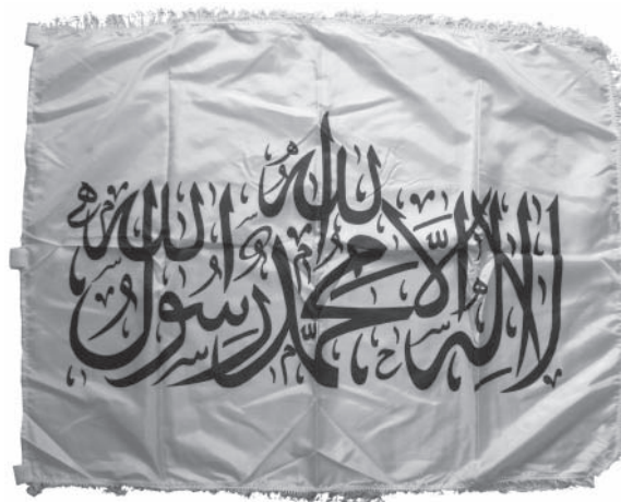
Gambar 8 Komposisi segiempat dengan penekanan pada lafaz Allah di bagian tengah atas

Sebagai objek estetis, liwa dan rayah memiliki nilai estetis. Nilai estetis yang terkandung pada bendera itu meliputi nilai simbolis, nilai ikonis, dan nilai indeksikal. Nilai simbolik merupakan kaitan antara bendera tersebut dengan Islam dan konsep penegakan Khilafah. Hubungan liwa dan rayah dengan Islam dapat dilihat pada charge bendera tersebut, yaitu kalimat sahadat. Pernyataan laa ilaaha illa Allah Muhammad Rasul Allah hanya ada di dalam Islam, dan menjadi syarat mutlak yang harus diucapkan seseorang ketika menyatakan keislamannya. Kalimat tersebut juga selalu dibaca saat orang Muslim melaksanakan sholat. Keterkaitan liwa dan rayah dengan Islam, dalam konteks HTI DIY, ditegaskan melalui pernyataan Rasyid Supriyadi, Ketua DPD HTI DIY bahwa bendera tersebut bukanlah bendera HT atau organisasi tertentu, tetapi bendera Islam. Selain itu, secara terbuka dalam aksi “Mengutuk Rencana Pembakaran al-Quran” di depan Kantor Pos Pusat Yogyakarta tanggal 29 Agustus 2010, orator aksi menyerukan, “Kibarkan liwa dan rayah ! Bendera itu adalah bendera Rasulullah, bendera umat Islam, bukan bendera organisasi manapun.”