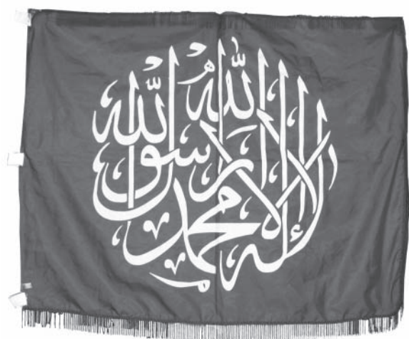
Gambar 7 Komposisi khat berbentuk lingkaran