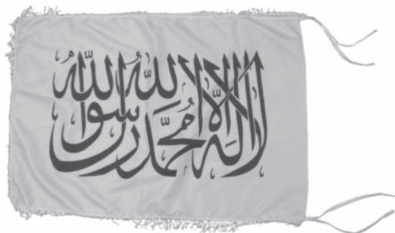
Gambar 1 Liwa berwarna dasar putih dengan kalimat sahadat berwarna hitam

Semua bendera yang digunakan HTI DIY menggunakan khat sulus , tetapi komposisinya beragam, misalnya terdapat yang berkomposisi segiempat (gambar 1), lingkaran (gambar. 7), atau segiempat dengan penekanan lafaz Allah di bagian tengah atas (gambar. 8). Keragaman juga terjadi pada ukuran, rasio, maupun displai.