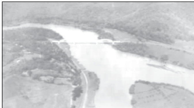
Jembatan Kereta Api milik Serajoedal Stoomtram Maatschappij (NV. S.D.S.) yang melintasi Sungai Serayu di sekitar Purwareja-Klampok pada tahun 1920

Satu tahun setelah proyek ini dikerjakan, trem siap untuk dioperasikan. Berturut-turut jalan cabang Maos-Purwokerto dibuka untuk umum tanggal 16 Juli 1896. Jalur Purwokerto-Sukorejo dibuka pada tanggal 5 Desember 1896, Jalur