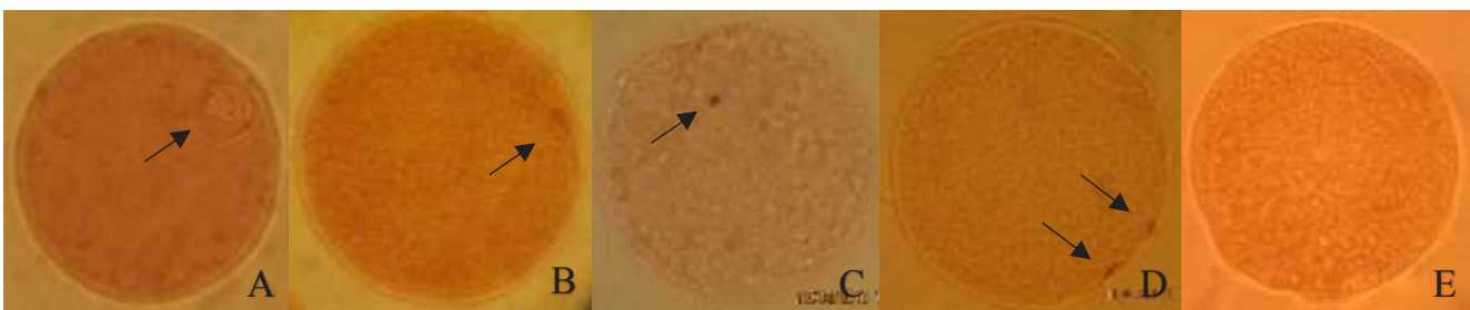
Gambar 1. Perkembangan status inti oosit setelah maturasi in vitro . A. Germinal vesicle (GV), B. Germinal vesicle breakdown (GVBD), C. Metaphase I (MI), D. Metaphase II (MII), E. Degenerasi, (tanda panah); (perbesaran 200x).

Keberhasilan perkembangan embrio sapi secara in vitro dilakukan dengan pengamatan dan pewarnaan ( aceto orcein ). Stadium pembelahan embrio mulai dari 2-32 sel disajikan dalam Gambar 2.