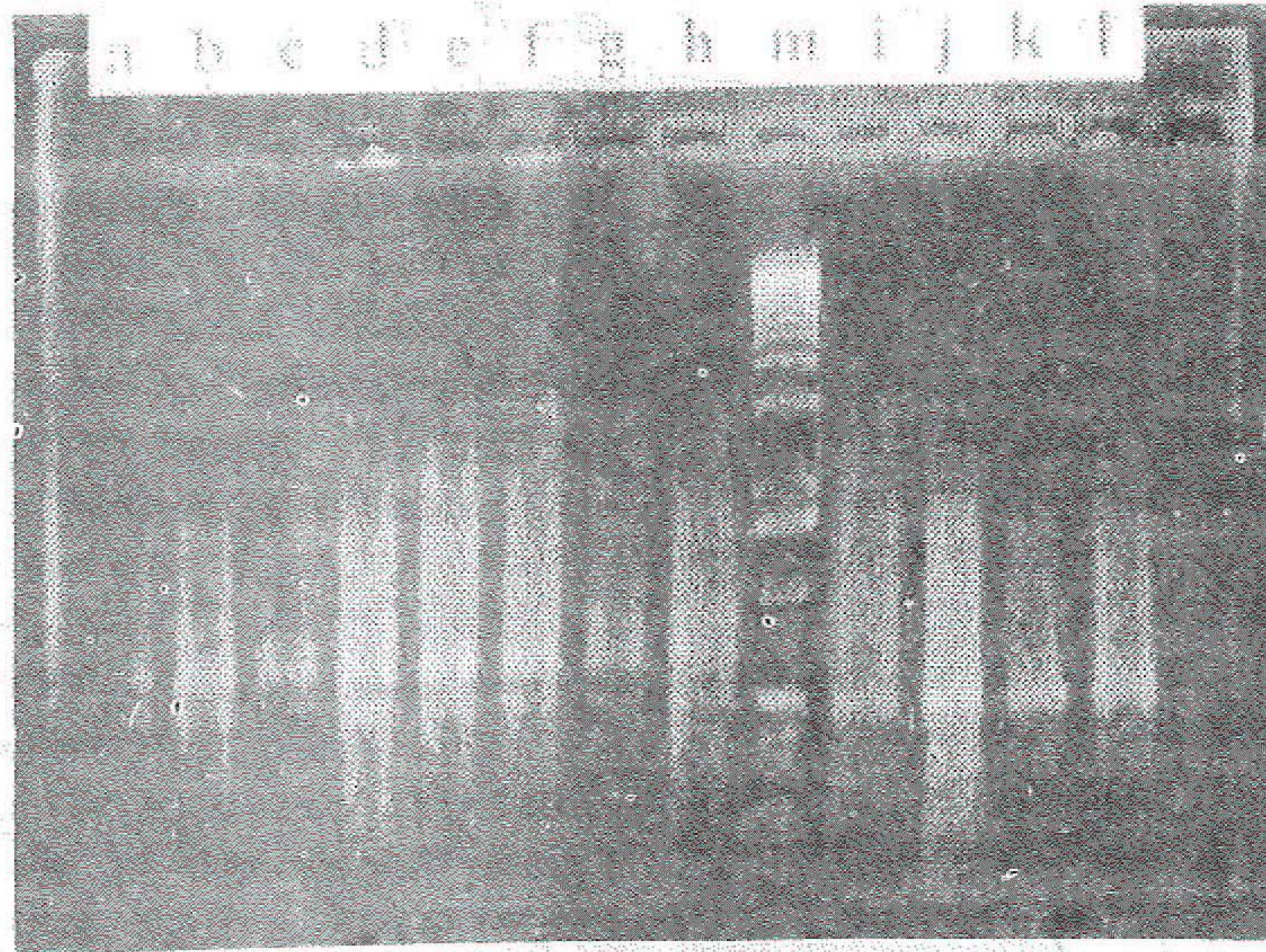
Gambar 1. Hasil analisis RFLP dengan enzim HindIII (a - d), EcoRI (e - h), BamHI (i - l) dan marker (m) a, c, e, g, i, k = cacing betina dari Napu; b, f, j = cacing jantan dari Napu; d, h, l = cacing jantan dari Lindu.

Individu cacing dewasa jantan dan betina diekstraksi dengan menggunakan metoda phenol-chloroform/isoamyl alkohol , kemudian di presipitasi dengan sodium chlorida dan dilarutkan dengan TE buffer.