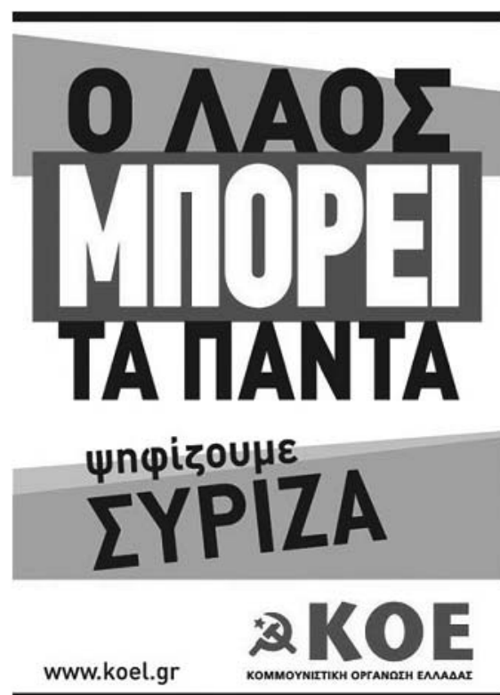
Gambar 1. Poster KOE Dalam Pemilu Juni 2012