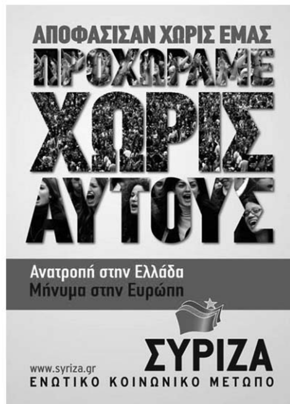
Gambar 2. Poster Kampanye Syriza Pada Pemilu Mei 2012