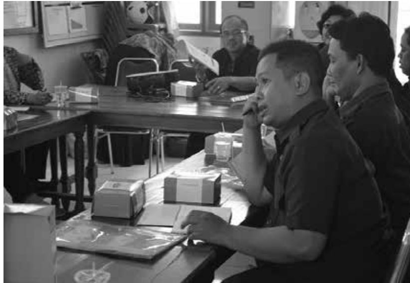
Gambar 5. Diskusi dan tanya jawab