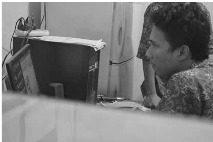
Gambar 6. Pendampingan penggunaan sistem informasi manajemen puskesmas

Gambaran umum penggunaan sistem informasi manajemen puskesmas di Puskesmas Dlingo I: