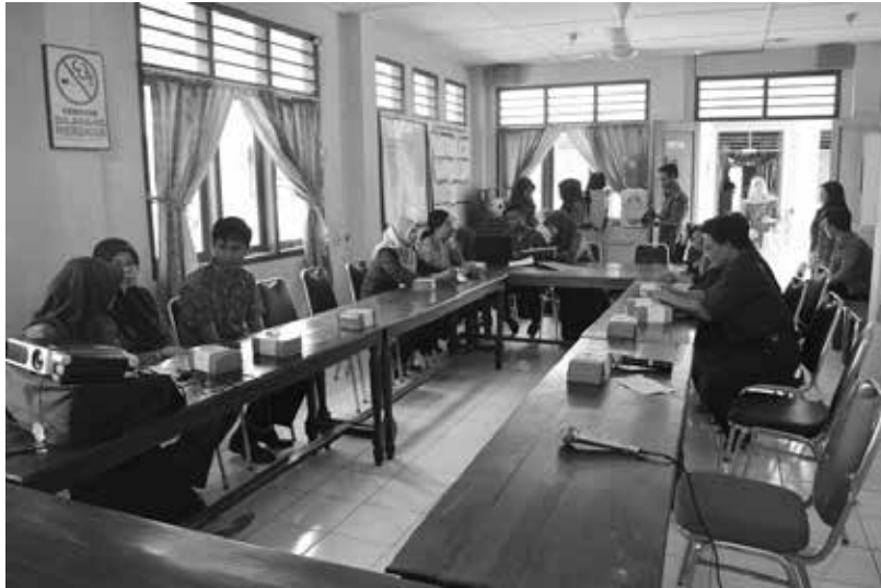
Gambar 3. Kegiatan PKM

Penyampaian materi dilakukan oleh tim yaitu pemaparan terkait optimalisasi penggunaan sistem informasi puskesmas serta maintenance sistem yang dapat dilakukan sendiri oleh petugas puskesmas tanpa harus bergantung pada tim teknis dari Dinas Kesehatan Bantul.