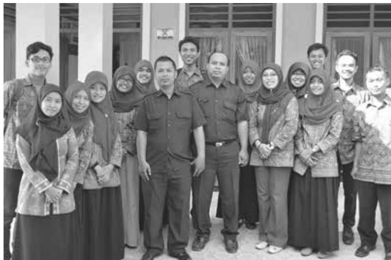
Gambar 7. Foto bersama

Kegiatan sosialisasi dan pelatihan penggunaan sistem informasi telah dilaksanakan di Puskesmas Dlingo I. Solusi terkait teknis penggunaan aplikasi p-Care dari BPJS telah diberikan termasuk saran untuk pengembangan sistem informasi manajemen puskesmas (IHIS) ke depan. Petugas di Puskesmas Dlingo I menyatakan bahwa kegiatan pelatihan dan pendampingan yang telah dilaksanakan Program Diploma Rekam Medis Sekolah Vokasi Universitas Gadjah sangat bermanfaat bagi mereka terutama dalam menangani kendala-kendala teknis dalam penggunaan sistem informasi di lapangan.