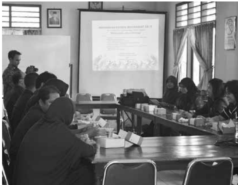
Gambar 2. Kegiatan PKM

Dalam sambutannya, Kepala Puskesmas Dlingo I menyampaikan bahwa kegiatan sosialisasi perlu dilakukan. Kegiatan pengabdian ini diharapkan dapat menambah keterampilan dan wawasan petugas terhadap penggunaan sistem informasi puskesmas.