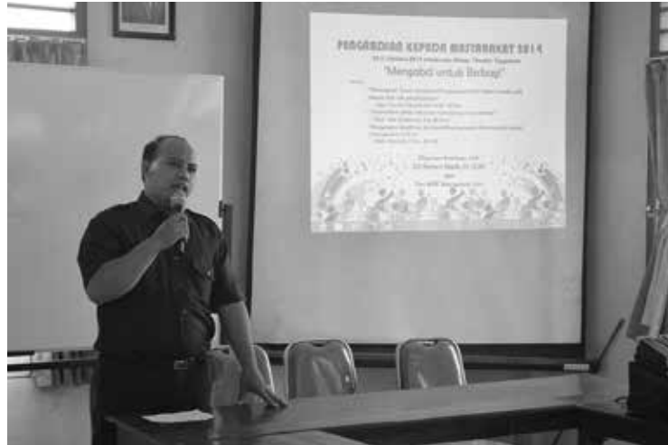
Gambar 1. Sambutan Kepala Puskesmas Dlingo I