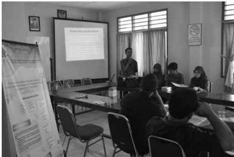
Gambar 4. Penyampaian materi sistem informasi di Puskesmas

Penyampaian materi dilakukan oleh tim yaitu pemaparan terkait optimalisasi penggunaan sistem informasi puskesmas serta maintenance sistem yang dapat dilakukan sendiri oleh petugas puskesmas tanpa harus bergantung pada tim teknis dari Dinas Kesehatan Bantul.