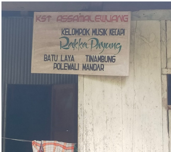
Gambar 5. Kelompok Musik Kecapi "Rakka Payung"