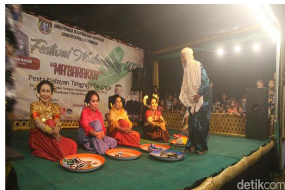
Gambar 2. Pertunjukan pakkacaping di polewali mandar

Kesulitan dalam mengembangkan musik tradisional Pakkacaping juga tercerminkan dalam penelitian Pala (2019) yang berjudul " Eksistensi Media Tradisional Pakkacaping Sebagai Media Penyampaian Informasi Publik di Kota Parepare " Menurutnya maraknya perkembangan media digital menggeser kebudayaan dan media tradisional Pakkacaping . Diakui, media tradisional Pakkacaping masih disenangi kalangan masyarakat tertentu berusia 40 tahun ke atas khususnya yang tinggal di pedesaan. Mereka cenderung memosisikan Pakkacaping sebagai aset dari kearifan lokal yang menghadirkan edukasi dan diseminasi informasi mengenai moralitas dan etika sosial kemasyarakatan.