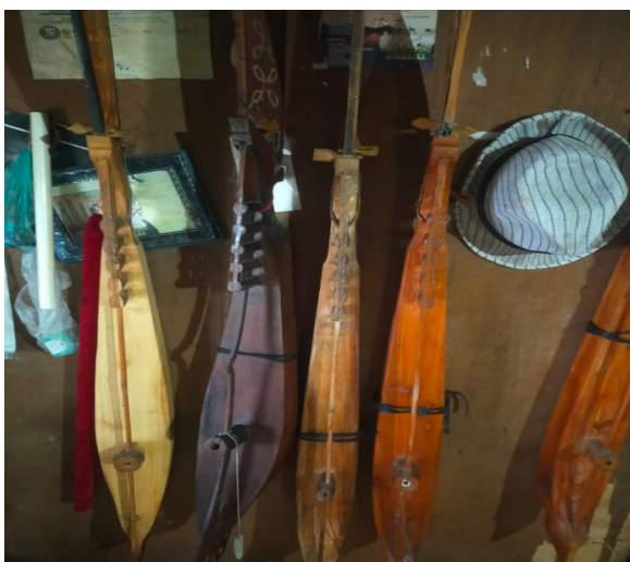
Gambar 3. Alat Musik Tradisional Pakkacaping

Musik tradisional Kacaping adalah suatu bentuk musik vokal instrumental