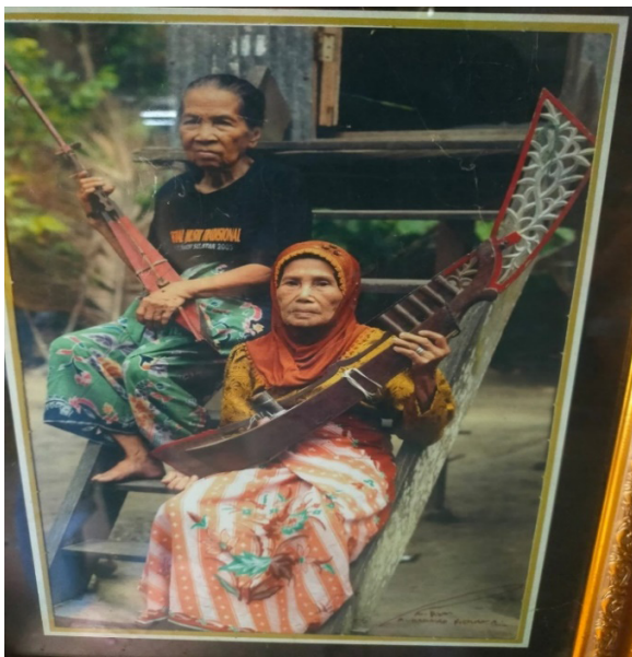
Gambar 7. Dukungan Orang tua kepada anak untuk belajar budaya Pakkacaping harus ditumbuhkan sejak kecil