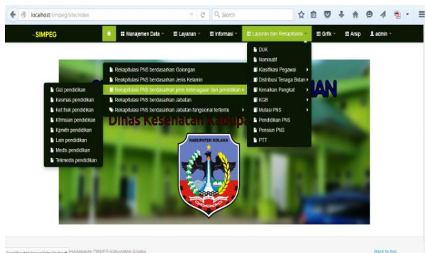
Gambar 5. Tampilan Menu Laporan dan Rekapitulasi Pegawai berdasarkan Jenis Ketenagaan dan Pendidikan

Output merupakan hasil akhir yang dihasilkan oleh sistem informasi. Hasil akhir pada umumnya berupa dokumen yang dicetak melalui printer komputer. Hasil akhir dapat digunakan dalam membantu pengambilan keputusan pada tingkat manajerial tertentu sesuai dengan laporan yang dibutuhkan. Salah satu output yang penting dan dibutuhkan oleh pengguna di dinas kesehatan yaitu laporan dan rekapitulasi pegawai berdasarkan jenis ketenagaan-pendidikan yang terdiri dari tenaga medis, keperawatan, kefarmasian, kesehatan masyarakat, gizi, keteknisan medis, keterampilan fisik dan tenaga lain seperti yang tampak pada gambar 5 berikut: