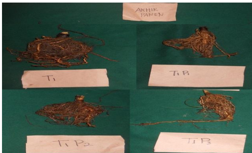
Gambar 2. Perakaran wijen bercabang saat panen akhir (keterangan kode P1: kerapatan 20 umbi teki, P2 : kerapatan 40 umbi teki, P3 : kerapatan 60 umbi teki)

Walaupun gangguan kerapatan teki memiliki umur berbunga yang cenderung lebih lama, tanaman wijen tersebut tidak dapat menghasilkan jumlah bunga yang banyak. Jumlah bunga wijen yang dihasilkan dari tanaman wijen yang terganggu kerapatan teki lebih sedikit dibandingkan dengan tanaman wijen yang tidak terganggu kerapatan teki (tabel 2). Jumlah bunga wijen berkurang sampai 76,31% jika terganggu kerapatan teki.