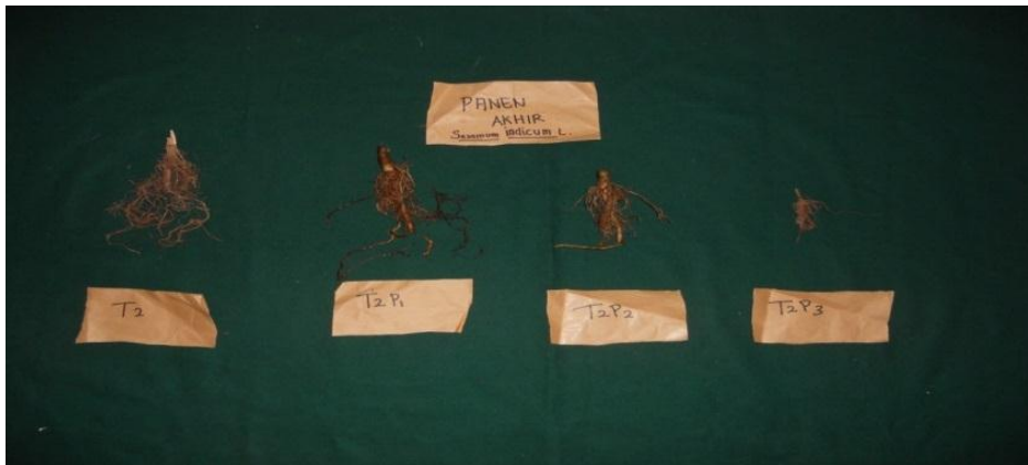
Gambar 1. Perakaran wijen tidak bercabang saat panen akhir (keterangan kode P1 : kerapatan 20 umbi teki, P2 : kerapatan 40 umbi teki, P3 : kerapatan 60 umbi teki)