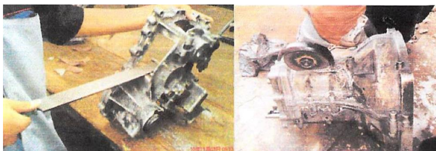
Gambar 3. Pembersihan dan penghalusan dari bekas pemotongan block tranmisi dan Transfer Suzuki SJ 410

Dalam membuat media pembelajaran Cutaway Suzuki SJ 410 dibuat dengan melalui beberapa tahapan antara lain observasi peralatan, perancangan pemotongan, melakukan pemotongan peralatan, merangkai dan menguji hasil rakitan. Proses perencanaan yang dilakukan adalah merancang dudukan transmisi dan transfer yang akan digunakan, merancang dengan menandai bagian-bagian pada bagian transmisi dan