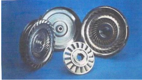
Gambar 6. Bagian-bagian Torque Converter setelah di belah

Mahasiswa akan lebih mudah menganalisa sistem kerja dari kopling otomatis mobil.