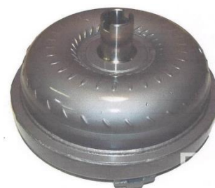
Gambar 5. Torque Converter sebelum di belah

Torque Converter yang bisa di sebut dengan kopling otomatis. Torque Converter tidak bisa dibongkar pasang jadi kalau ingin melihat atau mengetahui komponen di dalamnya dan cara kerjanya harus di potong atau di belah . Karena bahannya yang tebal untuk