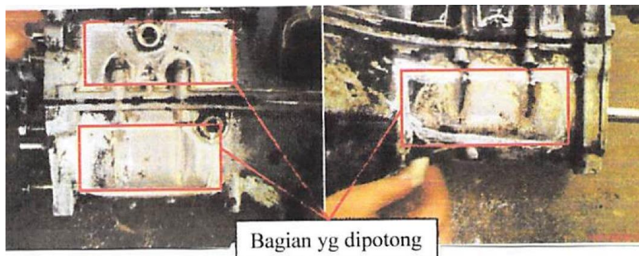
Gambar 2. Penandakan Cutaway block Tranmisi dan transfer Suzuki SJ 410

Media cutway adalah metode pembelajaran dengan cara membelah atau memotong peralatan atau mesin yang sebenarnya tanpa mengurangi komponen yang agar dapat mudah mengamati sistem kerja suatu peralatan mesin. Dengan peralatan di buka seperti itu mahasiswa akan dengan . dan tentunya hal ini juga akan menarik mahasiswa untuk belajar.