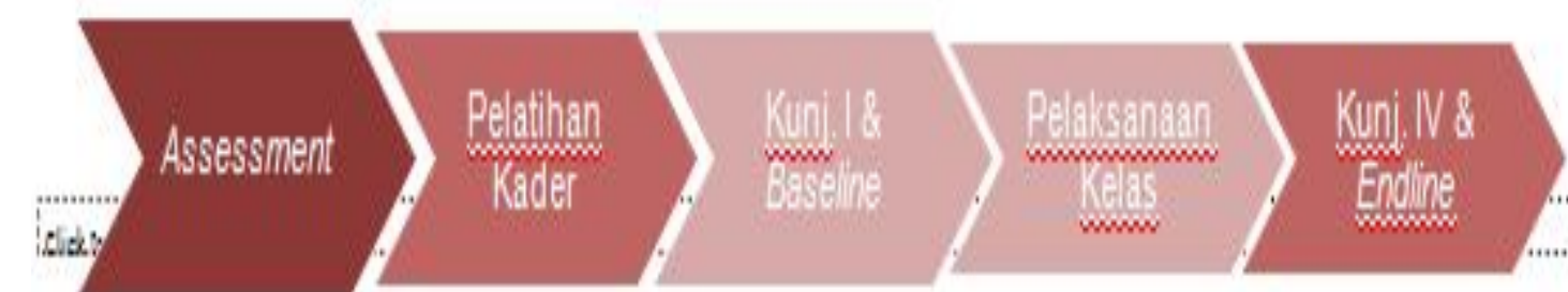
Gambar 2, Jadwal Pelaksanaan Kelas Go Baby Go