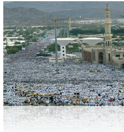
Image 1. Crowds at the Hajj

Problem kesehatan utama yang dihadapi jamaah haji secara umum terdiri dari Communicable Diseases dan Non Communicable Diseases. Penyakit saluran nafas sebagai CDs tertinggi (73,3%). Heat stroke/attack, Sunlight effects sebagai tertinggi NCDs (16,67%). Tragedi terinjak menjadi salah satu sebab kematian dengan kecenderungan naik turun. Penyakit kardiovaskuler menjadi penyebab 46-66 % kematian jamaah.. Diperlukan perubahan mindset bahwa persyaratan kemampuan kesehatan harus diterapkan dengan melakukan skrining, treatment dan penilaian kemampuan fisik sebelum keberangkatan.