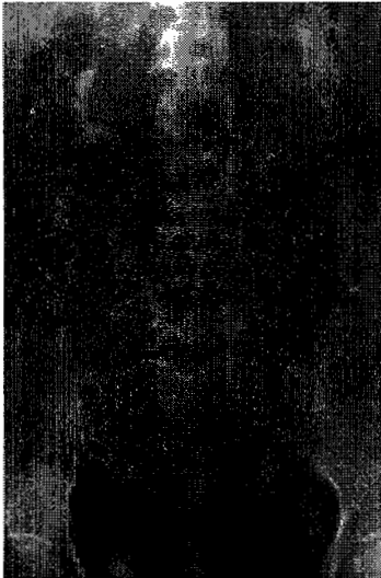
GAMBAR 3.- Gambaran ginjal kiri hydronephrosis, ureter kiri tak nampak.