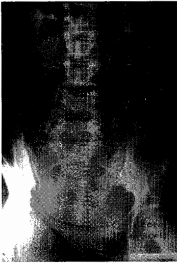
GAMBAR 1.- Gambaran PIV, tampak dilatasi ureter kiri, mulai dari articulatio sacroiliaca.