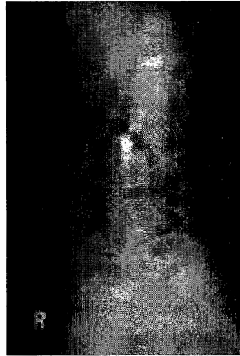
GAMBAR 2.- Seperti GAMBAR 1 dilihat dari samping.