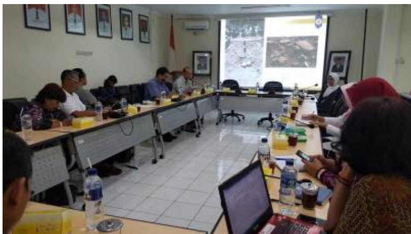
Foto 4. Pelaksanaan FGD dengan para stakeholder yang berkepentingan dengan pengelolaan Situs Gunung Wingko, di Balai Arkeologi DIY, 13 Juli 2018.