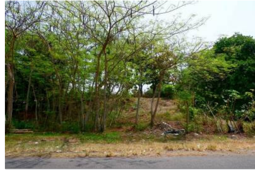
Foto 2. Situasi Situs Gunung Wingko yang masih berupa lahan kosong, dengan sejumlah fragmen gerabah di permukaannya (Dok. Riana Wulan Pradipta)