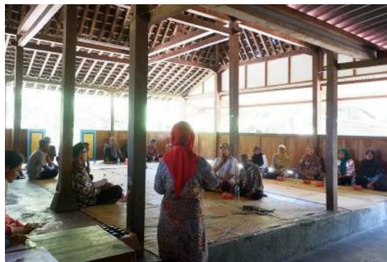
Foto 3. Sosialisasi nilai penting Situs Gunung Wingko melalui FGD di Dusun Ngepet, Kelurahan Srigading, 8 Mei 2018

Sosialisasi nilai penting Situs Gunung Wingko kepada masyarakat dilaksanakan melalui Focus Group Discussion (FGD) di wilayah Kelurahan Srigading pada 8 Mei 2018. Dalam acara yang diselenggarakan di rumah Kepala Dusun Ngepet tersebut hadir enam belas orang warga masyarakat yang tinggal di wilayah Kelurahan Srigading (Foto 3). Di antara para peserta, ada yang pernah terlibat membantu penelitian yang dilakukan oleh Dr. Gunadi Nitihaminoto, yakni sebagai tenaga lokal dan penyedia tempat menginap bagi tim peneliti. Dr.