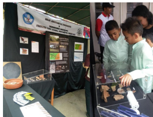
Foto 6. Pengunjung dan Bapak Camat Sanden memberikan informasi tentang Situs Gunung Wingko dalam Pameran Arkeologi pada Sanden Fair 2018