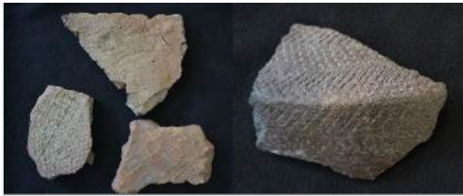
Foto 1. Fragmen gerabah dengan tera anyaman dan tenun (kiri) dan gerabah berhias dengan teknik tusuk (kanan)

Suko masih dapat dilihat singkapan stratigrafi yang dapat menjadi petunjuk keberadaan lapisan budaya yang mengandung temuan fragmen gerabah dan tulang hewan serta manusia (lihat Gambar 2). Sisa gumpuk pasir seperti ini perlu dilindungi sebagai bukti keberadaan Situs Gunung Wingko.