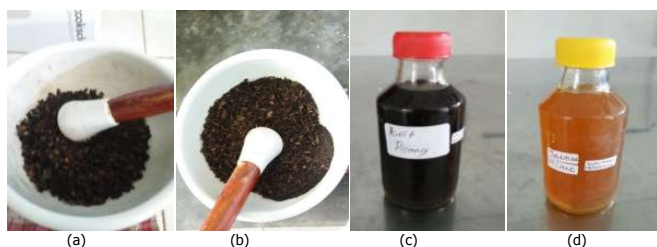
Gambar 1. Hasil simplisia kering dan ekstrak kental, (a) simplisia kulit pisang, (b) simplisia jantung pisang, (c) ekstrak kulit pisang, (d) ekstrak jantung pisang.

Ekstrak kulit dan jantung pisang muli diperoleh dari proses ekstraksi simplisia yang sebelumnya sudah mengalami proses pengeringan. Pengeringan sampel dilakukan untuk menurunkan kadar air pada sampel sehingga tidak mudah ditumbuhi kapang dan bakteri. Hal ini sesuai pendapat Prasetyo dkk. (2013) bahwa tujuan pengeringan adalah untuk mendapatkan simplisia yang tidak mudah rusak, sehingga dapat disimpan dalam waktu yang lebih lama. Selain itu juga untuk menghentikan aktivitas enzim yang dapat menguraikan lebih lanjut kandungan zat aktif di dalam sampel serta untuk memudahkan dalam hal pengelolaan pada proses selanjutnya (Nuria, 2010). Simplisia yang sudah kering dibuat dalam bentuk serbuk dengan tujuan untuk meningkatkan luas permukaan bahan baku, semakin luas permukaan maka bahan baku pengeringan akan semakin cepat dan kontak pelarut dengan senyawa yang akan diekstrak akan semakin baik. Hal ini akan menyebabkan senyawa aktif yang target akan lebih mudah terekstrak (Gunawan dkk., 2004).