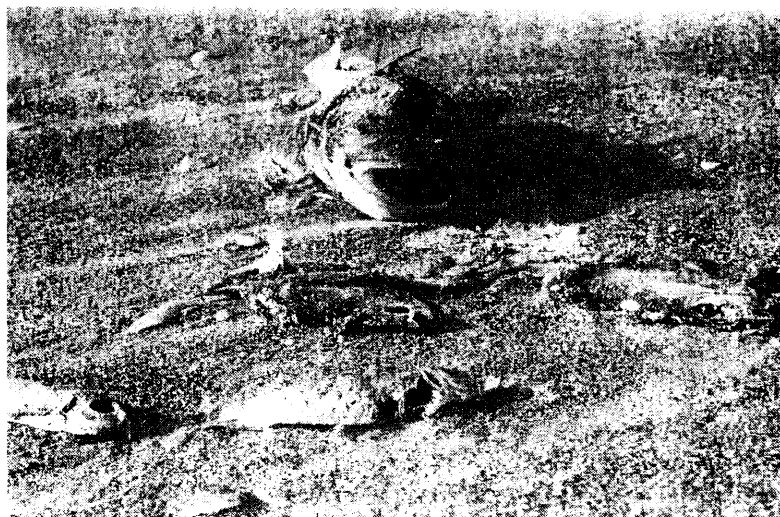
Gambar 2. Kematian beberapa jenis ikan akibat retaid

Kista Pyrodinium berasal dari pecahnya kista yang terbawa arus dan terjadi ledakan populasi di lokasi lain. Tahun 1999, keberadaan Pyrodinium di perairan Teluk Lampung, di Desa Hanura sekitar 8,9 \times 10^4 sel/liter air laut. April 2003, jumlah tersebut meningkat lebih 2 kali lipatnya menjadi 2,3 \times 10^9 sel/liter air laut. Dalam kondisi normal, mikroalga tersebut hanya ditemukan dalam jumlah kurang dari 10^2 sel per liter air laut.