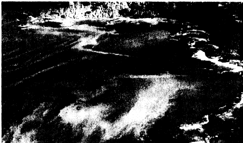
Gambar 1. Retaid muncul dengan variasi warna